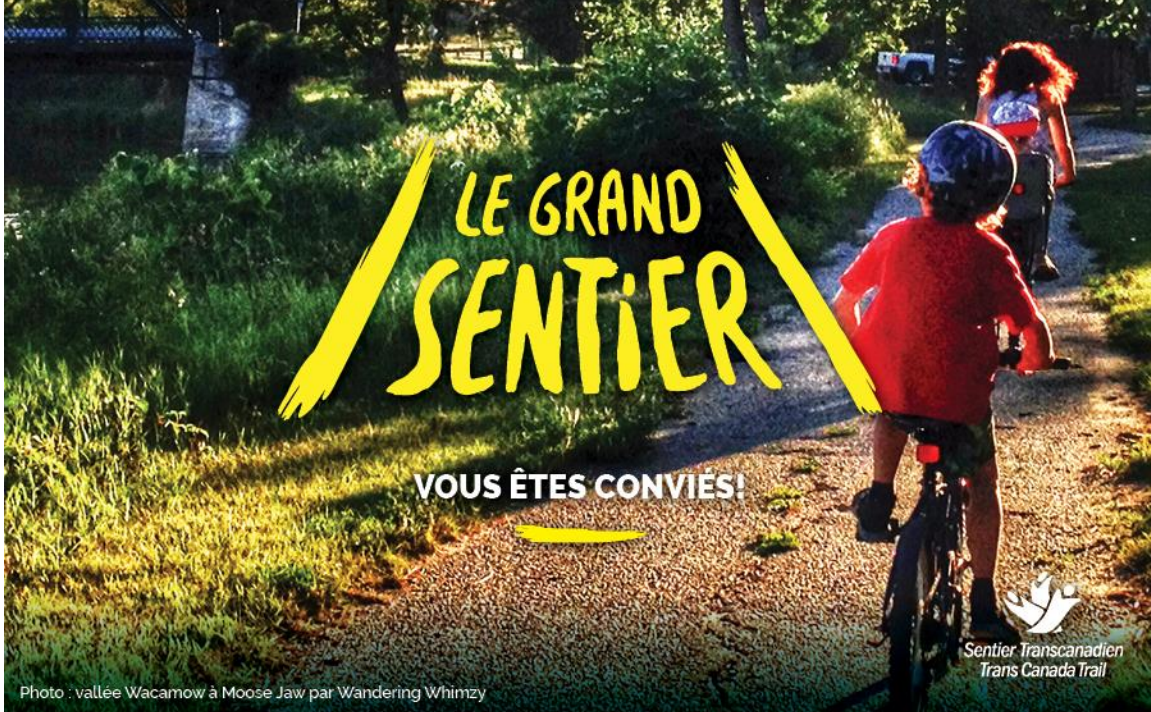
vallée Wacamow à Moose Jaw